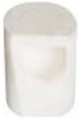
石英船坩 产品型号：CB-3