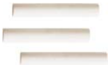
陶瓷棒 Ceramic Stir Rod