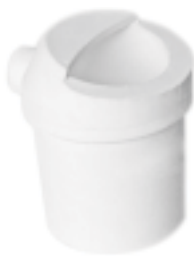
石英铸造坩埚 产品型号：CP-1200B 产品规格：Φ93*H105mm 产品重量：415g

Ceramic Casting Crucible Model : CPA-450D