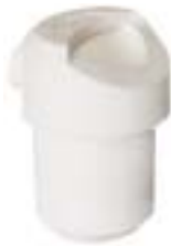
石英铸造坩埚 产品型号：CP-350D

Ceramic Casting Crucible Model : CP-350C