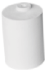
石英铸造坩埚 产品型号：CP-1200C 产品规格：Φ74*H104mm 产品重量：420g

Ceramic Casting Crucible Model : CP-1200B Size : Φ93*H105mm Weight : 415g