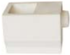
石英船坩 产品型号 : CB-20