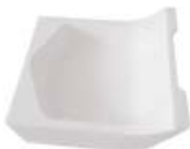
石英碗 产品型号 : CM-C73 产品规格 : L81*W81*H29(mm) 产品重量 : 260g

Ceramic Bowl Model : CM-C72 Size : L80*W80*H28(mm) weight : 260g