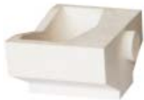
石英船坩 产品型号 : CB-75A 产品规格 : L100*W121*H65mm 产品重量 : 640g

Ceramic Boat Model : CB-50 weight : 688g