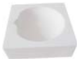
石英碗 产品型号 : CM-C72 产品规格 : L80*W80*H28(mm) 产品重量 : 260g

Ceramic Bowl Model : CM-70 Size : L50*W50*H28*Φ35(mm)