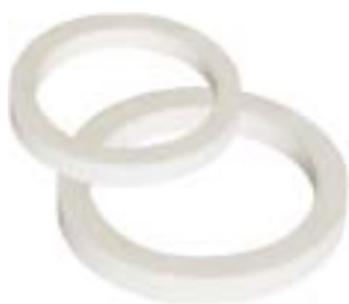
石英环 产品型号：CQA-78 产品重量：37g 产品型号：CQA-100 产品重量：56g