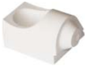
石英船坩 产品型号 : CB-10