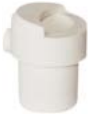
石英铸造坩埚 产品型号：CP-350C

Ceramic Casting Crucible Model : CP-350C