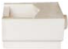
石英船坩 产品型号 : CB-50 产品重量 : 688g

Ceramic Boat Model : CB-50 weight : 688g