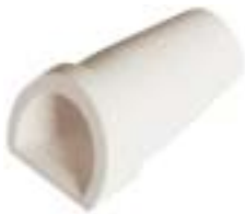
石英铸造坩埚 产品型号：CPA-450D

Ceramic Casting Crucible Model : CP-350D