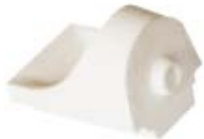
石英船坩 产品型号：CB-3