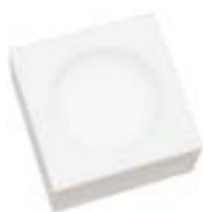
石英碗 产品型号 : CM-70 产品尺寸 : L50*W50*H28*Φ35(mm)

Ceramic Bowl Model : CM-70 Size : L50*W50*H28*Φ35(mm)