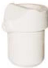
石英铸造坩埚 产品型号：CP-350A

Ceramic Casting Crucible Model : CP-250B Size : Φ56*H69mm Weight : 135g