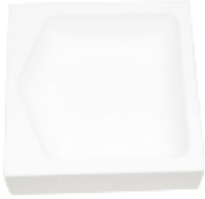
石英碗 产品型号：CM-80 产品尺寸：L121*W121*H41(mm)