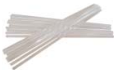
透明石英棒 产品型号：QR-002 产品规格：Φ10×L400 (mm)