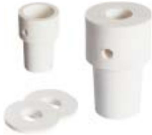
石英铸造坩埚 产品型号：CP-150

Ceramic Casting Crucible Model : CP-150D