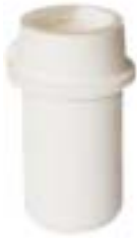
石英铸造坩埚 产品型号：CP-150D

Ceramic Casting Crucible Model : CP-150D