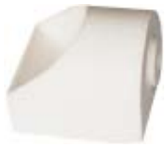
石英船坩 产品型号 : CB-30AB