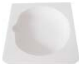
石英碗 产品型号 : CM-C74 产品规格 : L100*W100*H28(mm) 产品重量 : 380g

Ceramic Bowl Model : CM-C73 Size : L81*W81*H29(mm) weight : 260g