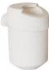
石英铸造坩埚 产品型号：CP-350B

Ceramic Casting Crucible Model : CP-350A