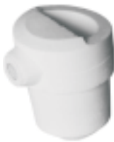
石英铸造坩埚 产品型号：CP-250B 产品规格：Φ56*H69mm 产品重量：135g

Ceramic Casting Crucible Model : CP-250B Size : Φ56*H69mm Weight : 135g