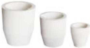
石英碗 Ceramic Bowl 产品规格Specification：