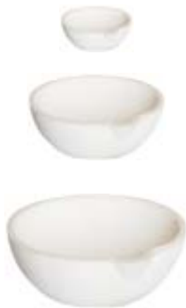
石英碗 Ceramic Bowl 产品规格 Specification :