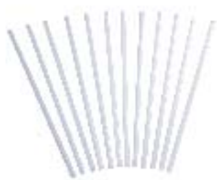
乳白石英棒 产品型号：QR-001 产品规格：Φ10×L400(mm)