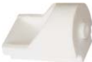
石英船坩 产品型号：CB-3B