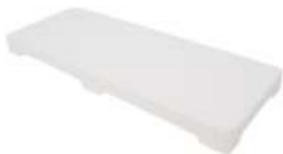
石英焊板 产品型号：HB-06 产品规格：L284*W1128*H22(mm)